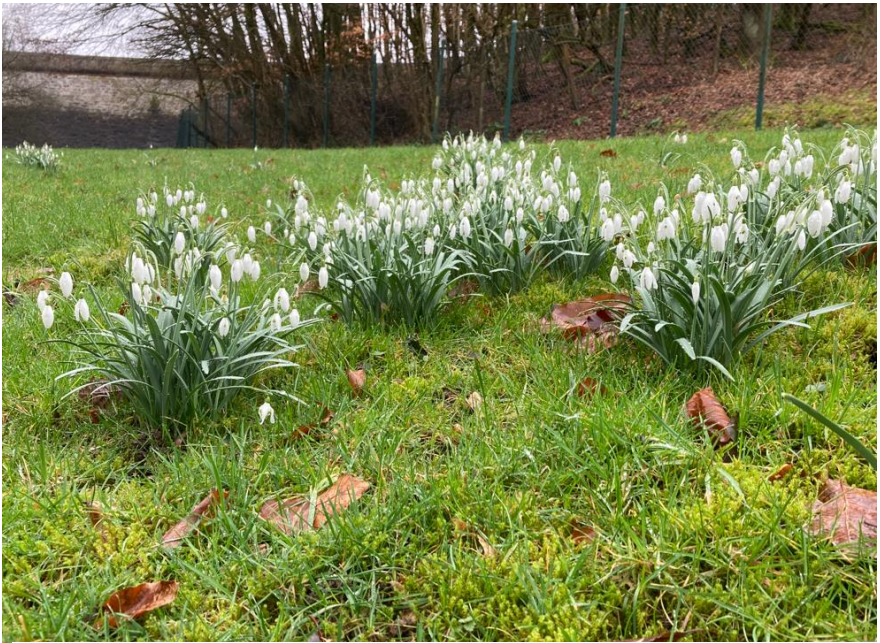
Die ersten Frühlingsboten am Fuß der Sperrmauer